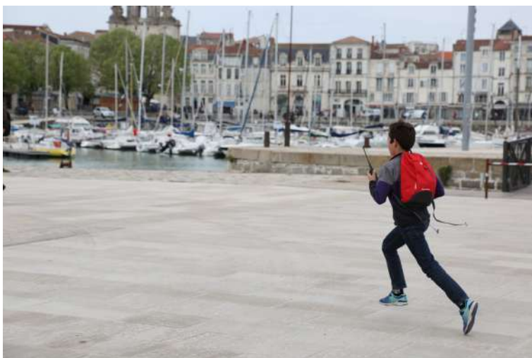
Spectateurs complices – La Rochelle (17)

En partant, nous laissons des missions et des surprises à ouvrir en attendant notre retour pour les représentations. Il y a 10 enveloppes. Certaines sont nécessaires au bon déroulé du spectacle. D'autres sont des enveloppes dites « bonus ».