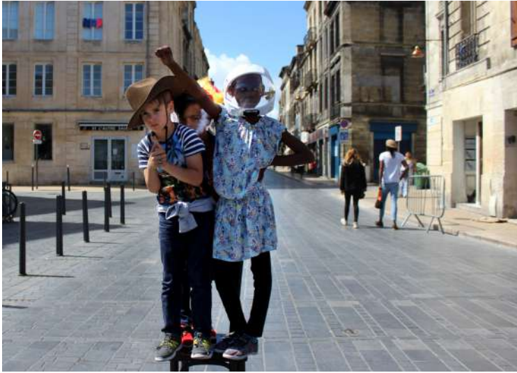
Spectateurs complices – Bordeaux (33)

J'ai bien aimé courir après le chat dans la rue, j'étais avec tout le monde, j'étais heureuse, je riais ! Thaïs. J'ai bien aimé quand on courait après le chat car d'habitude, on ne court pas dans les rues. Là, on pouvait ! Renan.