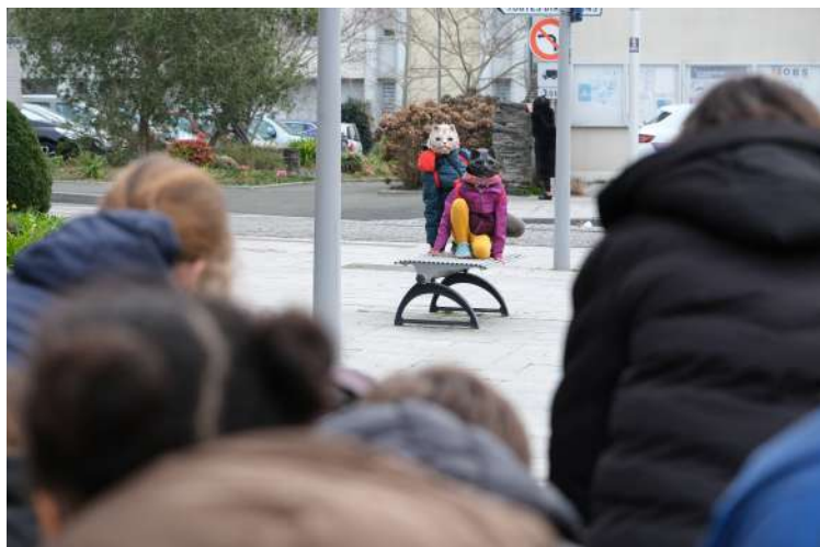
Spectateurs complices –Colombes (92)

Paroles d'enfants de l'école d'Ascaïn, complices de la résidence de création écrivent des mots à l'intention des prochains enfants complices :