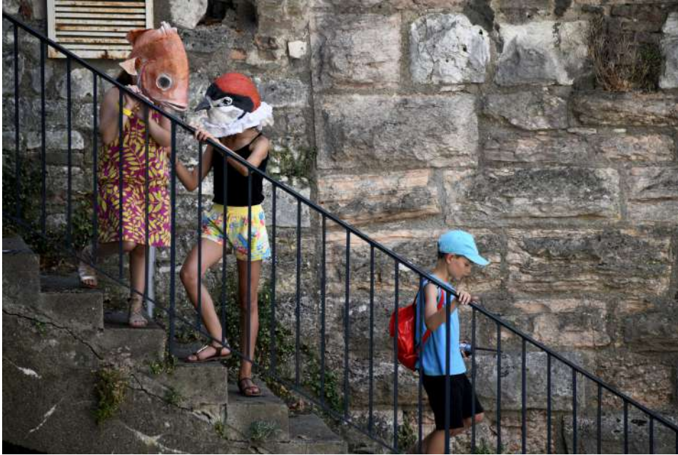
Spectateurs complices – Chalon sur Saône (71)

Le spectacle 50 mètres, la légende provisoire a été créé en 2019. Depuis il rencontre des groupes d'enfants dans divers territoires. A chaque rencontre il questionne le groupe : quelle est la place de l'enfant dans l'espace public ?